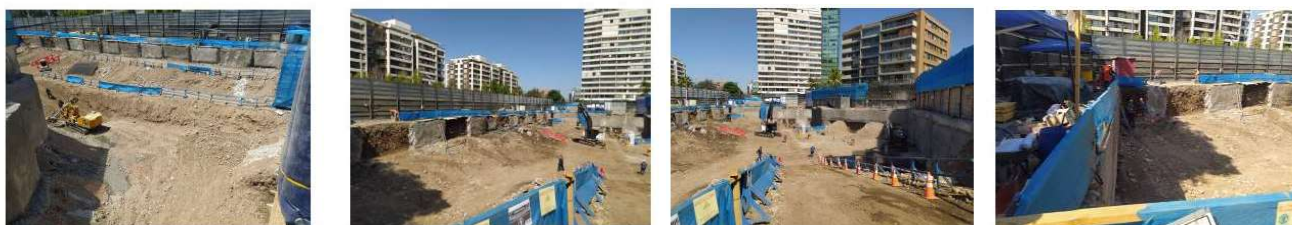
Avance soil nailing sector sur poniente