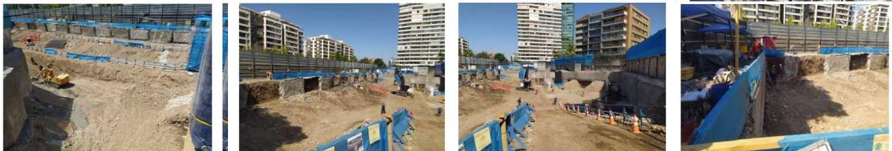
Avance soil nailing sector sur poniente